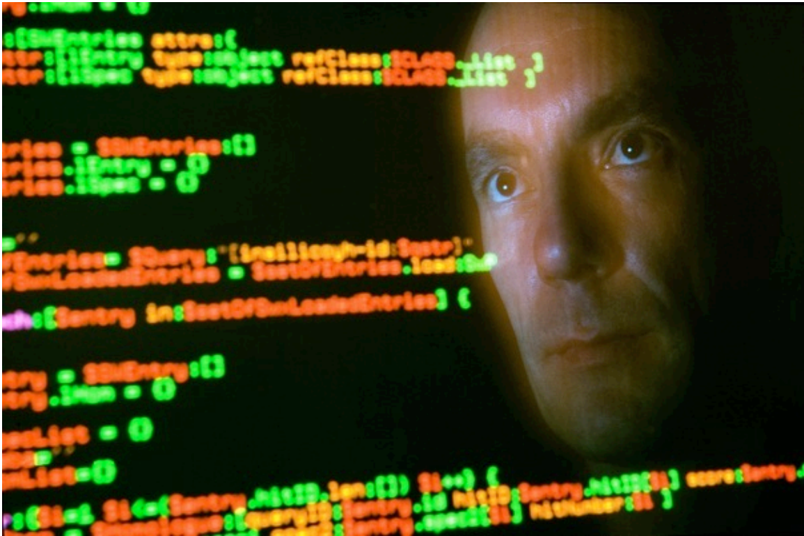
Bioinformatiker, Lion Bioscience AG